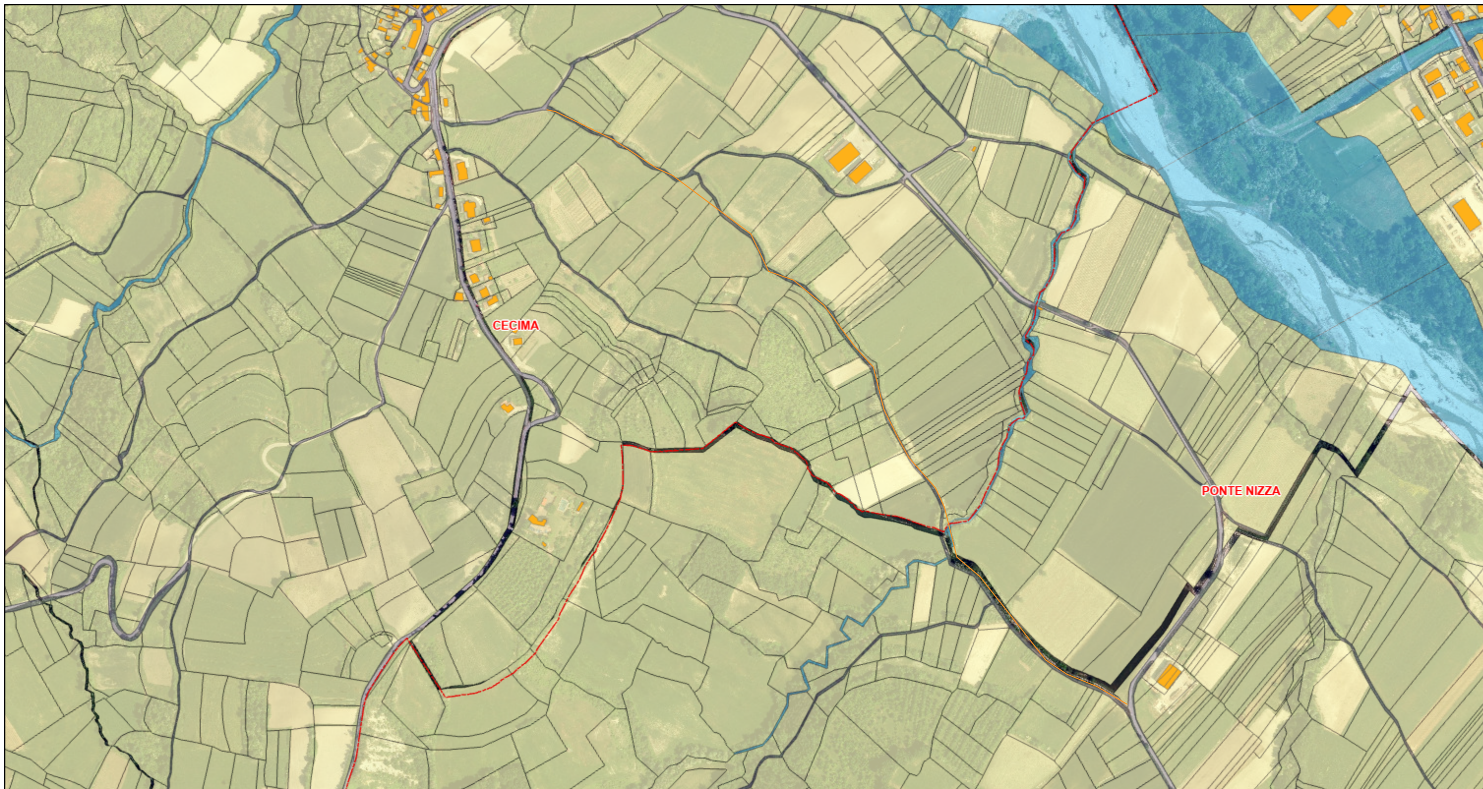
Tavola 3 b - Individuazione del tracciato della strada oggetto di intervento e estratto catastale